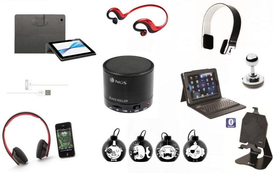
Periferiche per Tablet&Smartphone