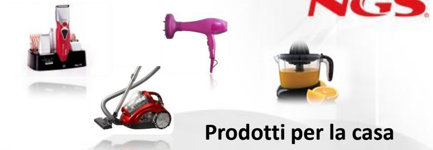
Prodotti per la casa