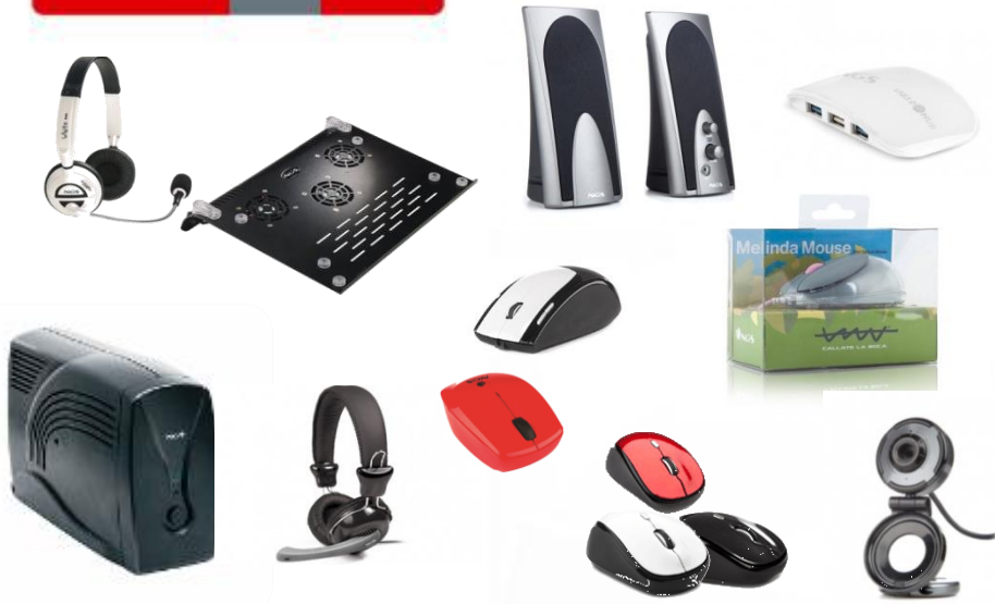
Periferiche per Computer