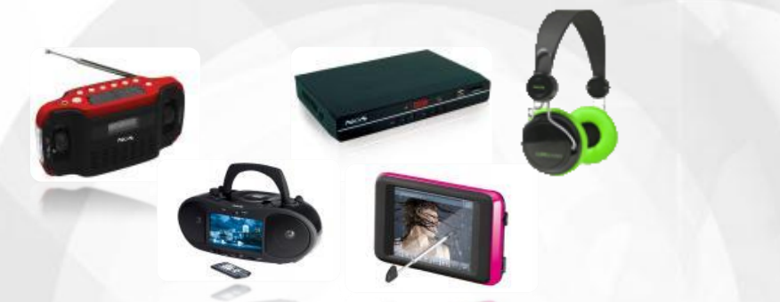
Elettronica di consumo